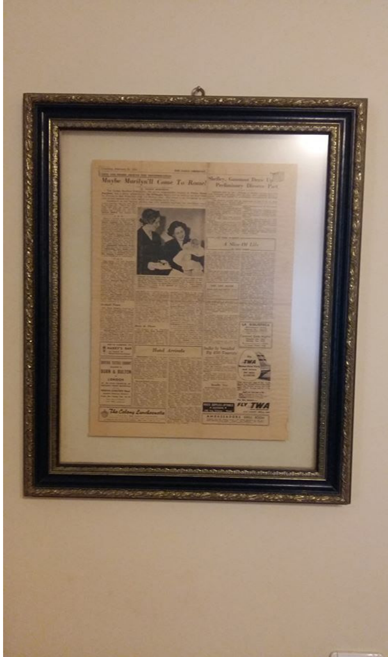
Görsel 1: Turan Çağlar'ın çerçevelediği Amerikan gazetesinin sayfası