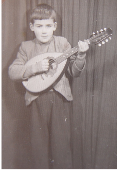
Okula başladığım yıl 1949